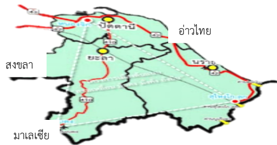
มาเลเซีย

๕) สร้างความเข้มแข็งของสังคมพหุวัฒนธรรม โดยสร้างความเข้าใจและการยอมรับในการอยู่ร่วมกันของสังคมพหุวัฒนธรรมเพื่อการอยู่ร่วมกันอย่างสันติสุข อนุรักษ์ฟื้นฟูและรักษาอัตลักษณ์ วัฒนธรรมท้องถิ่นที่หลากหลาย สนับสนุนกิจกรรมการแลกเปลี่ยนวัฒนธรรม รวมทั้งสร้างความเข้มแข็งของ สถาบันทางศาสนาเพื่อเผยแพร่หลักคำสอนที่ดีงามให้แก่ประชาชน สร้างเครือข่ายการมีส่วนร่วมของชุมชนในการดูแลรักษาความปลอดภัยของชุมชนและท้องถิ่น เพื่อป้องกันและแก้ไขปัญหาความไม่สงบในภาค