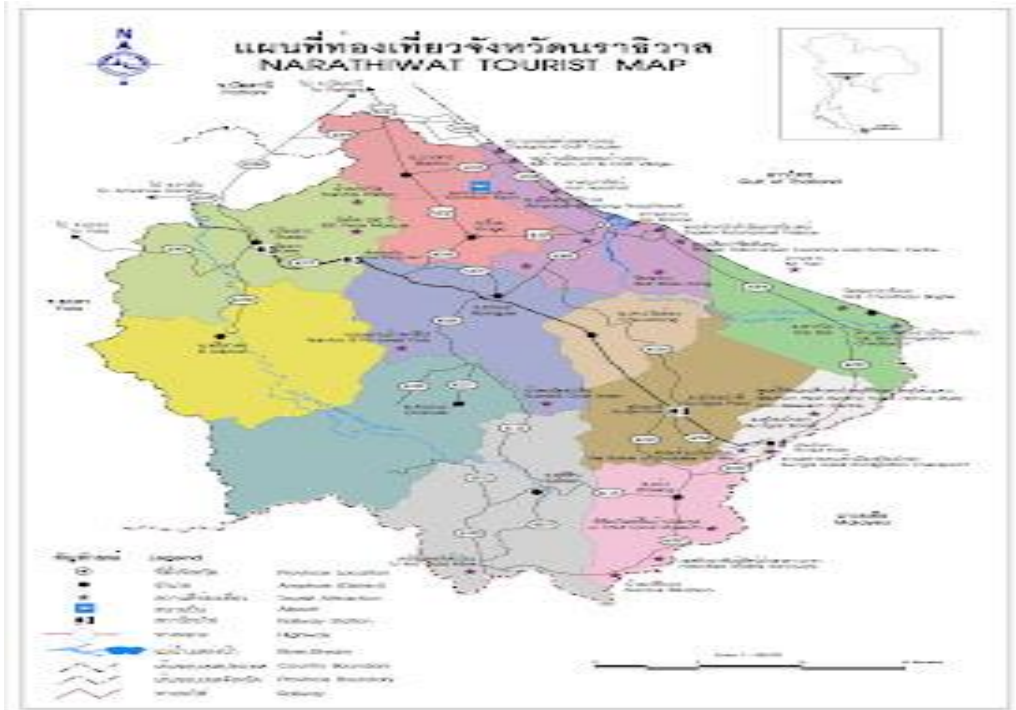
(๔) แผนพัฒนาขององค์กรปกครองส่วนท้องถิ่นในเขตจังหวัดนราธิวาส วิสัยทัศน์ขององค์กรปกครองส่วนท้องถิ่นในเขตจังหวัดนราธิวาส

๔.๕ สร้างพื้นที่ให้ประชาชนมีความปลอดภัย สงบสุข อยู่อย่างเข้าใจซึ่งกันและกัน และภาคภูมิใจในพื้นที่